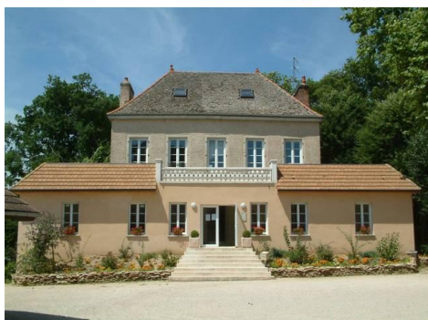
Bâtiment administratif - accueil